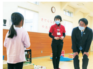
▲こども創作活動館。雨や雪の日も安全に子どもたちが遊べる施設

また、こども創作活動館や寺山公園内の交流施設「い〜てらす」などがあり、子育てしやすい環境が整っています。枝垂れ桜で有名なじゅんさい池公園や牡丹山諏訪神社古墳などの観光地や史跡も多くあります。ぜひ東区の魅力を探しに出掛けてみてはいかがでしょうか。