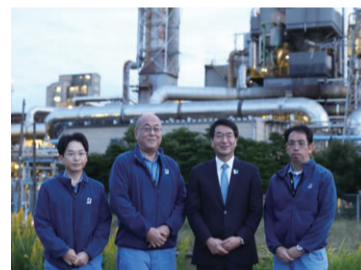
▲同社は、タイヤなどに使うカーボンブラックを製造。東区役所主催の「工場夜景バスツアー」にも協力 ※大山ポンプ場脇で撮影

——通船川沿いに立つ旭カーボン(株)の夜景を拝見しました。工場は24時間体制で稼働し、夜間に職員の方が安全に点検するための明かりが魅力的な工場夜景になっています。