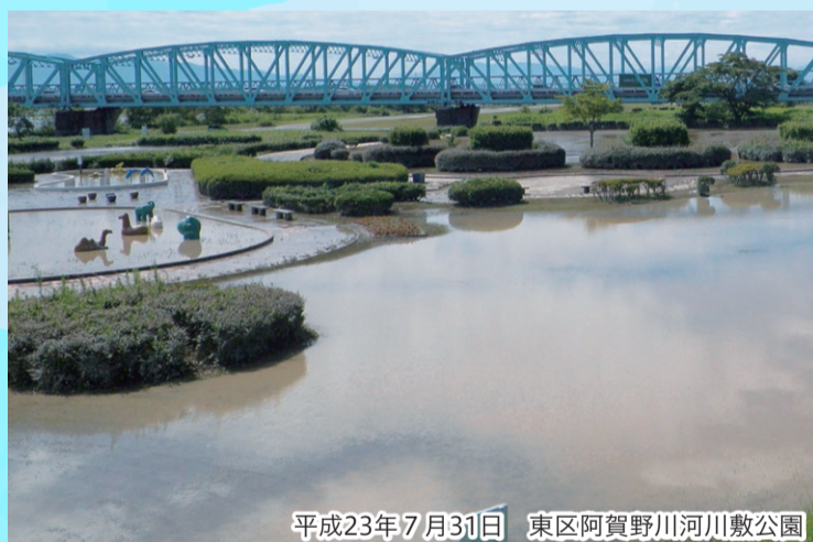
平成23年7月31日 東区阿賀野川河川敷公園

全国各地で毎年のように豪雨災害が発生しています。今号では、水害への備えについて取り上げます。