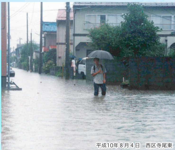
平成10年8月4日 西区寺尾東