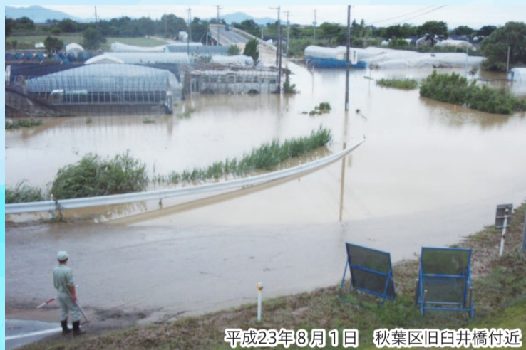
平成23年8月1日 秋葉区旧白井橋付近