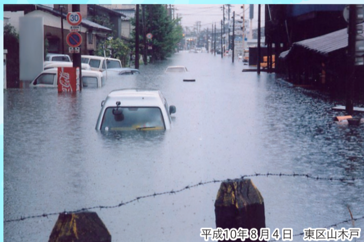
平成10年8月4日 東区山木戸