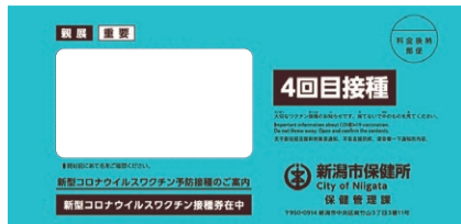
▲接種券送付用封筒(表)