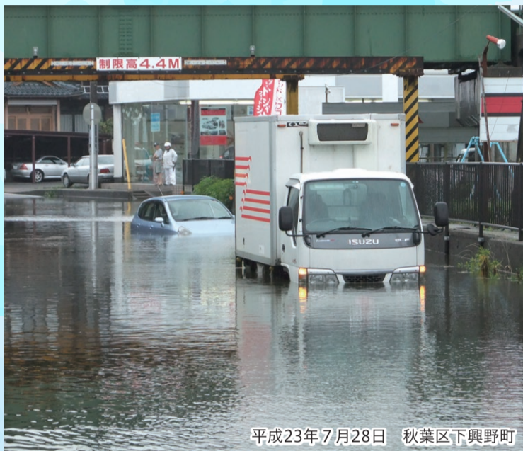
平成23年7月28日 秋葉区下興野町