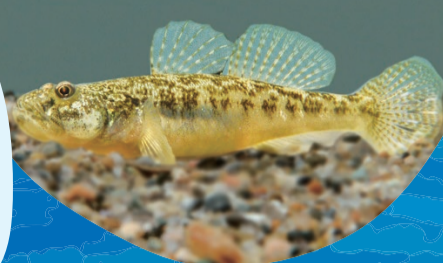
同施設で国内初展示しているコシハセ