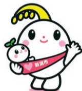
新潟市子育て 応援キャラクター 「ほのわちゃん」