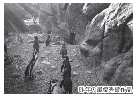
昨年の最優秀賞作品

対 同施設で撮影した写真 申 11月11日(金)までにメール(photo@marinepia.or.jp)で作品と所定の応募票を同施設(☎025-222-7500)へ ※応募票、募集要項は同施設HPに掲載