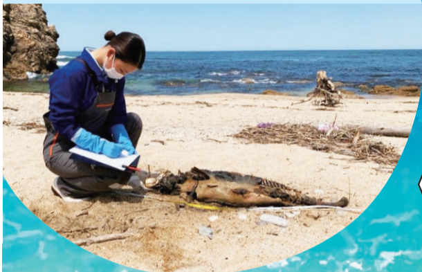
5月下旬に村上市に漂着したクジラ類を確認している様子

日本海の生き物のことを知って、海を守るために自分ができることを考えてみませんか。