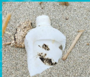
西区の海岸に漂着した洗剤容器

近年、街から流れ出るごみが海を汚しています。「アザラシやウミガメの首やヒレにごみが引っ掛かる」「粉々になったプラスチックを魚が食べ、体から排出できず弱ってしまう」といった被害が報告されています。新潟の海岸に漂着したカメのお腹からビニール袋が見つかったこともありました。