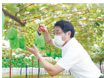
▲白根グレープガーデンの重さ約800gのシャインマスカット。10月中旬ごろまで食べ頃です