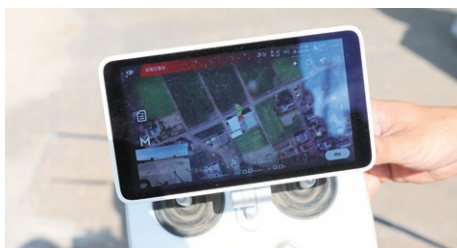
◀ドローンのコントローラー。タブレット画面を見ながら操作する。専用のアンテナを使うことで、位置情報の誤差は数cm以内に収まる

株式会社白銀カルチャー (秋葉区岡田) 経営面積 128.2ha(水稻48.9ha、大豆55.9ha、麦9.9haなど) 従業員 10人(平均年齢36歳) スマート農業技術の導入による省力化などが評価され、農林水産省・全国担い手育成総合支援協議会主催「2021年度全国優良経営体表彰」生産技術革新部門で農林水産省経営局長賞を受賞