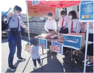
▲9月4日の沼垂テラス商店街での出店の様子。用意した商品は販売開始後20分ほどで完売

「廃棄予定の規格外品などを通常より安く買えるショッピングサイトなど、誰でも日常生活の中でお得に食品ロス削減に貢献できる仕組みがあります。私たちの活動をきっかけに、多くの人が食品ロス削減に取り組んでもらえたらいいです」と話してくれました。