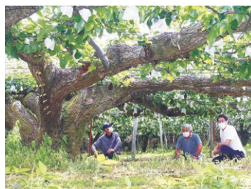
▲二十世紀梨の大樹。大郷地区は肥沃な土壌を有し、梨の栽培にとっても適しているとのこと