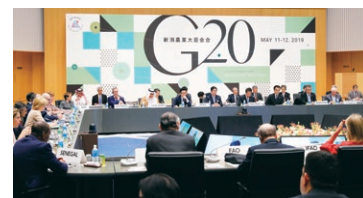
▲2019年に新潟市で開催されたG20サミット農業大臣会合の様子

これまでの財務相会合では、マクロ経済政策のサーベイランス(相互監視)、国際通貨システムのほか、開発、新興市場国など幅広い政策課題についての議論が行われています。