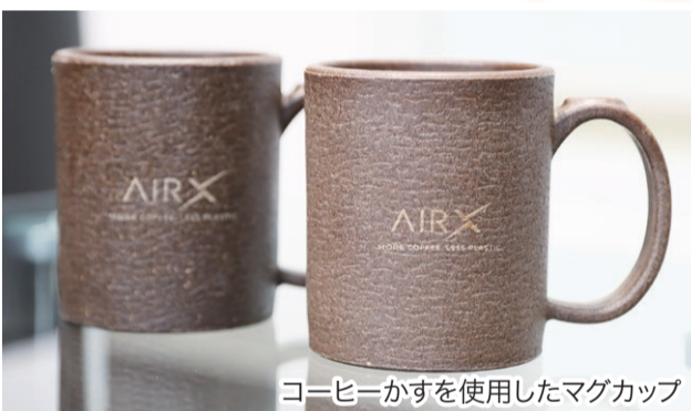
コーヒーかすを使用したマグカップ

新潟市は、市内での起業・開業や、新製品・新事業の開発に向けた取り組みを支援しています。今号では、新潟市の中小企業支援について取り上げます。