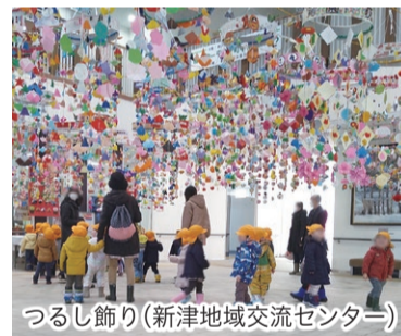
つるし飾り(新津地域交流センター)