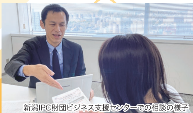
新潟IPC財団ビジネス支援センターでの相談の様子