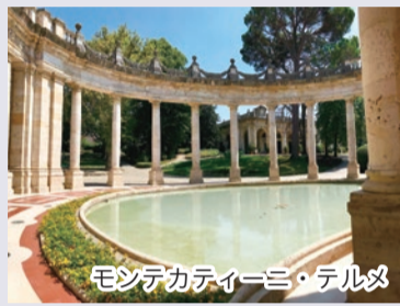
モンテカティーニ・テルメ

イタリアでは温泉は「Terme」と呼ばれ、古代ローマ時代から公衆浴場や温泉文化が発展しています。フィレンツェ近郊の温泉「モンテカティーニ・テルメ」には世界でも珍しい温泉洞窟が楽しめる施設があり、数々の著名な文化人に愛されたリゾート地として知られています。