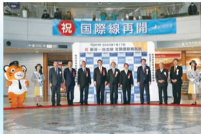
▲就航記念セレモニーの様子