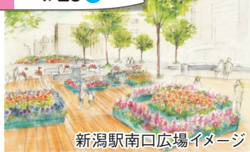
新潟駅南口広場イメージ