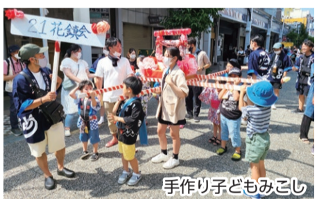
手作り子どもみこし