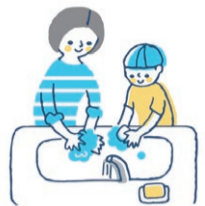
手洗いなどの手指消毒