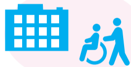
受診時や医療機関・高齢者施設などを訪問するとき