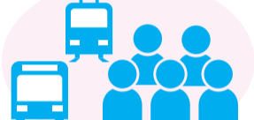
通勤ラッシュ時など、混雑した電車・バスなどに乗車するとき