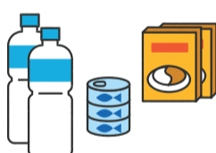
1週間分の食料や日用品