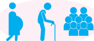
高齢者や基礎疾患がある人、妊婦など、重症化リスクの高い人が感染拡大時に混雑した場所に行くとき