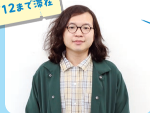
シウシェエディレン 煮雪の人さん 出身 台湾 分野 詩

佐渡の鬼太鼓と祭りを考察し、新潟が舞台の「擬物語詩」を日本語と中国語で制作します。また、新潟のミュージシャンと一緒に朗読音声も作りたくです。