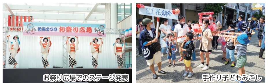
お祭り広場でのステージ発表