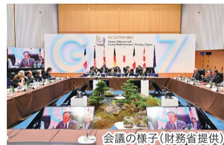
会議の様子

G7新潟財務大臣・中央銀行総裁会議が5月11日~13日に朱鷺メッセで開催されました。市民ボランティアをはじめ、多くの市民の皆さんからのご協力ありがとうございました。