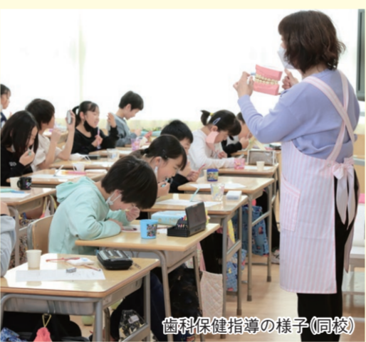
歯科保健指導の様子(同校)

学校で歯科衛生士さんに、虫歯や歯肉炎の予防方法について教えてもらいました。食事やおやつを食べる回数を増やすぎず、食べる時間も長くしすぎない方が、虫歯を予防しやすいことに驚きました。授業で習った歯ブラシやデンタルフロスの使い方をいつもの歯磨きに生かして、これからも自分の歯を守っていきたいです。