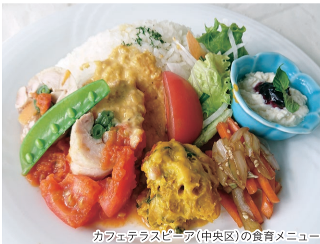
カフェテラスピア(中央区)の食育メニュー