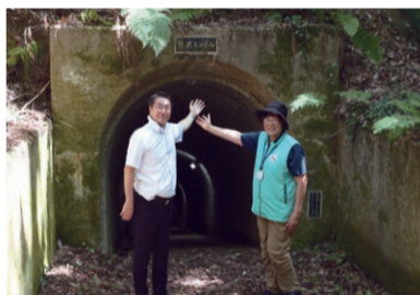
▲熊沢トンネル。当時は、通行料が必要だった。現在のものは昭和50年に改修されたもの。

——秋葉山の遊歩道を進んでいくと突然現れたのが熊沢トンネルです。明治33年に完成した同トンネルは人力で掘られたもので、山越えをして運んでいた原油や資材の運搬距離が短くなり、人の往来も格段に便利になったそうです。