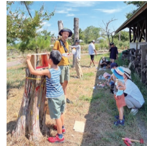
▲枯れ木に色付けしたり、流木をくくり付けたりしながら、親子でアート制作を楽しむ様子