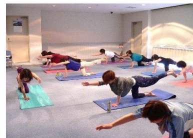
多様な健康教室の実施