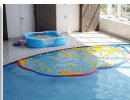
あひるプール（構成団体他施