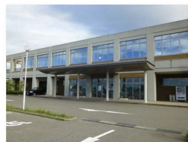
長く市民に親しまれる施設であるために