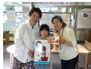
父の日ガラポン大会