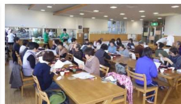
健康食を食べよう(構成団体他施設)