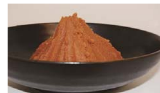
産学官連携により開発した 「無塩味噌」