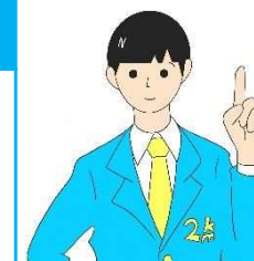
ニイガタニキロー