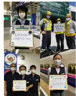
ありがとうメッセージ 駅構内掲出イメージ