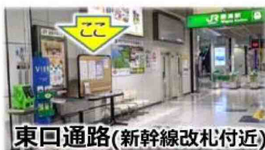
東口通路(新幹線改札付近)